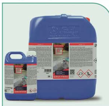
Imagem que mostra a embalagem real do produto, a sua apresentação comercial e o seu aspeto físico. Permite identificá-lo visualmente e diferenciá-lo de outras referências.